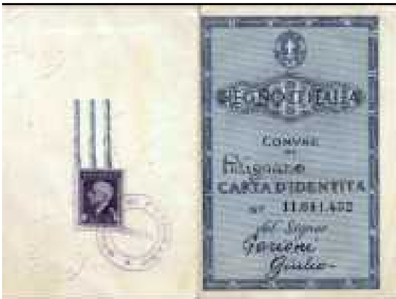
Documento falso di Uccellini in divisa Scout

L'O.S.C.A.R. è riservato solo al gruppo delle Aquile Randagie milanesi; ai loro fratelli monzesi non viene detto nulla di tutto ciò per motivi di sicurezza perché più persone fai entrare in organizzazioni simili più c'è il rischio di venire scoperti.