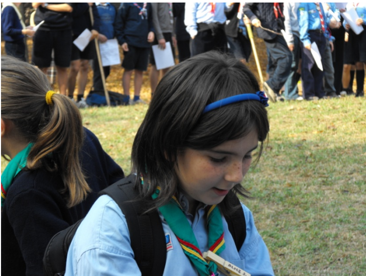
Io da lupetta

E' sicuramente un modo molto forte per far capire anche a chi non condivide la vita Scout perché non la capisce, non la ritiene utile, o addirittura la disprezza, i valori che essa trasmette e la forza ed il coraggio che dà a colui che l'abbraccia. Per sempre!