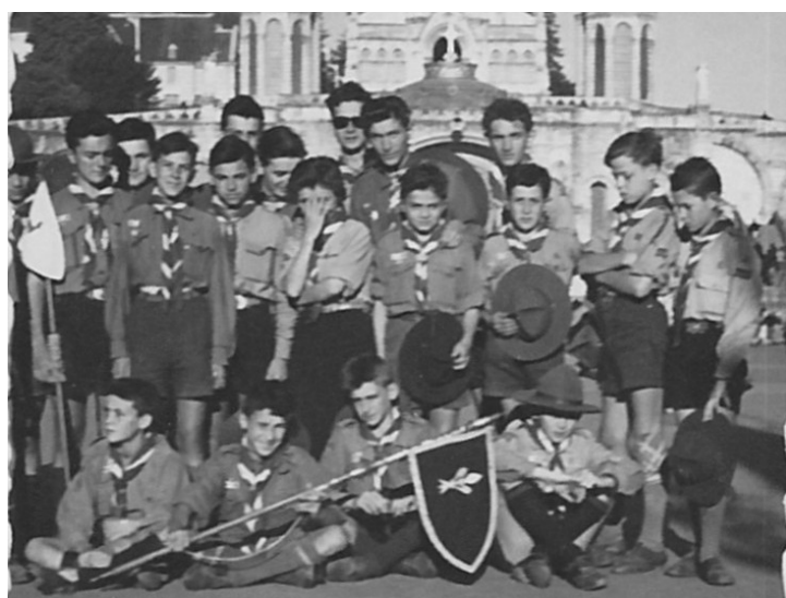
Uno dei primi Reparti del dopoguerra