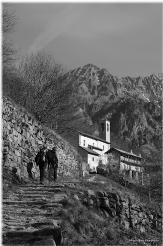
Val Codera al tempo delle AR