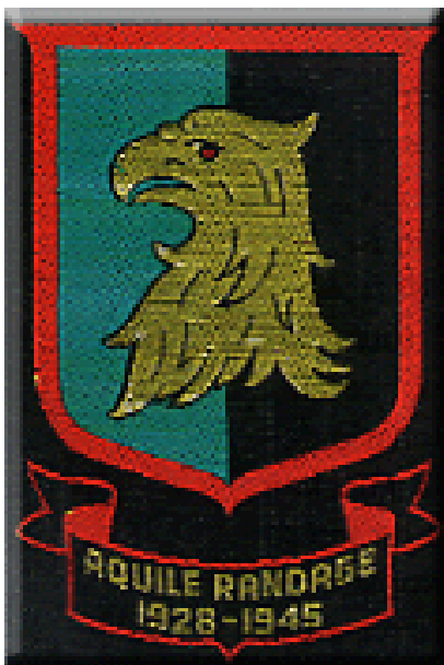
Distintivo / Logo delle Aquile Randagie

Il 4 ottobre 1942 le AR aspettano Kelly che, partito solo in bicicletta ed in perfetta divisa, le deve raggiungere a Desio. Non arrivò mai: è stato ritrovato agonizzante e sanguinante la sera sulla strada provinciale tra Niguarda e Bresso. Il regime pubblica sul giornale che il ragazzo è stato investito; invece si tratta di un pestaggio da parte di alcuni fascisti che gli procurarono lesioni in tutto il corpo, la frattura della clavicola sinistra e della base cranica e gli lascerà come "ricordo" difficoltà di udito e di equilibrio.