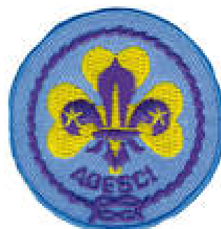
Distintivo di appartenenza al movimento dell' AGESCI

Oggi l'AGESCI conta più di 72.000 ragazzi che ancora oggi perseguono gli ideali di BP e pronunciano la loro Promessa.