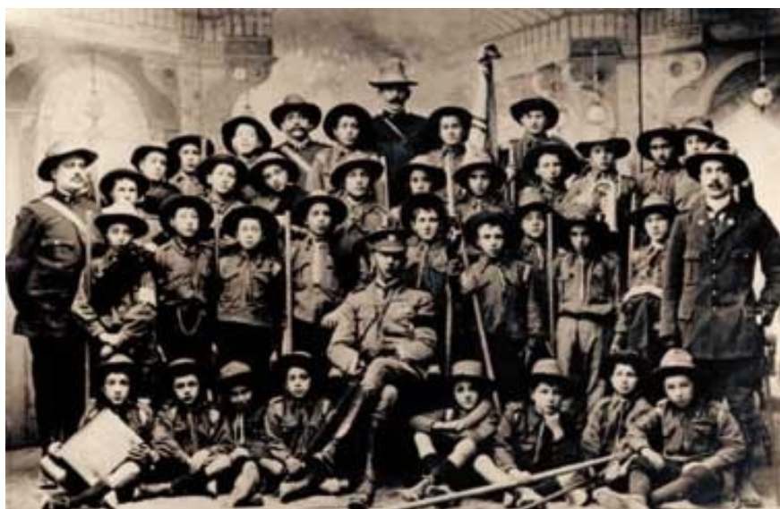
Uno dei primi Riparti Italiani di Molinari