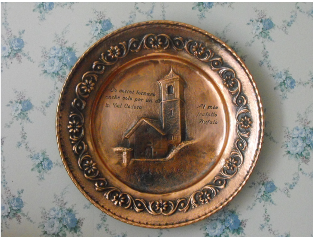
Piatto ricevuto in regalo da uno Scout svizzero che frequentava la Val Codera difatti le scritte dicono: "Io vorrei tornare anche solo per un dì in Val Codera. Al mio fratello Bufalo".

..... Perché uno Scout è uno Scout per sempre!