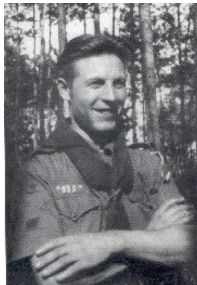
Fracassi (Sparviero del Mare) fatto prigioniero in Africa

Negli anni più bui della Giungla Silente, la Val Codera diventa il "Santuario" delle Aquile Randagie e da allora ancora oggi è una delle mete obbligate dei campi scuola di Colico.