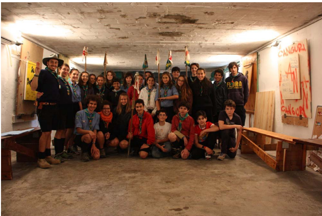
Foto del Reparto Antica Fenice Gruppo CREMONA 3

5 gennaio 2012 – La mia Promessa in Reparto durante il Campo Invernale