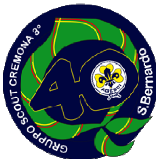
Logo dei 40 anni del mio gruppo scout

Io ci credo ancora: non è facile però fa bene al cuore avere un amico che ti aiuta, che ti sostiene, che ti ascolta, che ti apprezza per quello che sei.